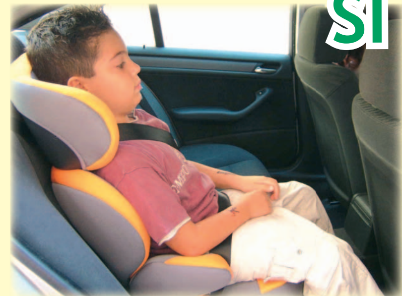
Seggiolini auto "gruppo 2 - 3"