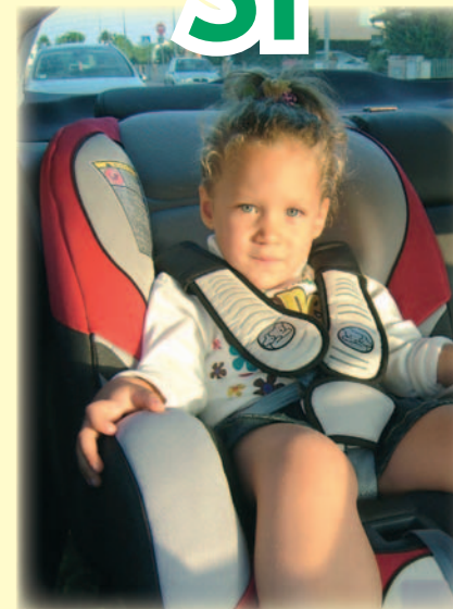
Seggiolino auto "gruppo 1"