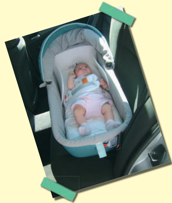
Navicella "gruppo 0"