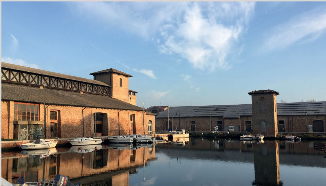
Magazzino del Sale Torre e Magazzino Darsena