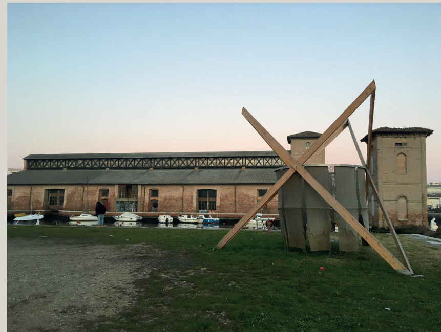
Area all'aperto antistante la chiesa di Sant'Antonio